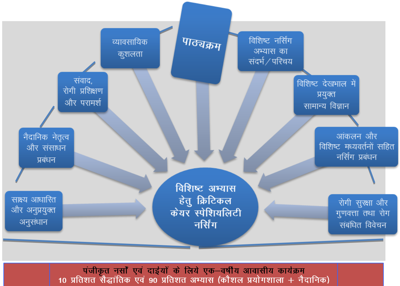
चित्र-1. क्रिटिकल केयर स्पेशियलिटी नर्सिंग – आवासीय कार्यक्रम की पाठ्यक्रम संरचना