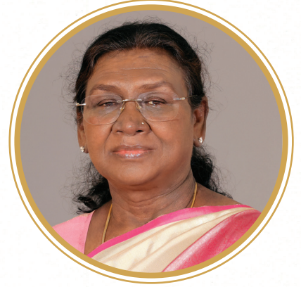
Smt. Droupadi Murmu President of India

राष्ट्रपति भारत गणतंत्र PRESIDENT REPUBLIC OF INDIA